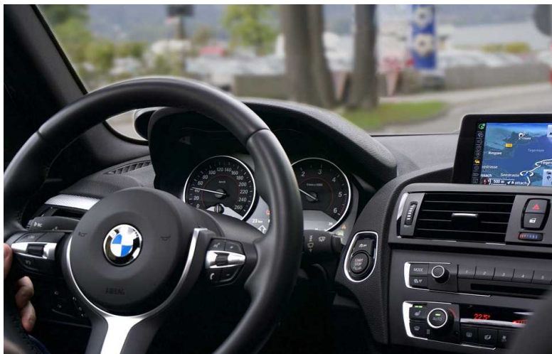
Ein Wagen von BMW - bald auch mit israelischer Technologie?.

BMW reiht sich damit in eine Liste von Autoherstellern ein: auch die Daimler AG sowie Volkswagen und das tschechische Škoda Auto a.s. haben bereits Zentren für Forschung und Entwicklung in Israel.