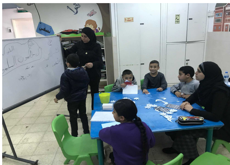
Kinder des „Lernen durch Spielen“-Programms in Ramle.

Die Bildungsprogramme für die israelisch-arabische Bevölkerung, setzen da an, wo der Staat oftmals versagt. In den Schulen zum Beispiel, wo verhaltensauffällige Kinder oder solche, die nicht mitkommen, nicht speziell gefördert werden können. Auch das Nachhilfeprogramm „Lernen durch Spielen“ für Grundschulkinder in Ramla gehört zu den Programmen des TRUST-Zentrums. Geleitet wird es seit kurzem von Sabrin Salama. Die 29-Jährige stammt aus Betlehem und ist genauso wie Elesawi nach Israel gekommen, um einen arabisch-israelischen Mann zu heiraten. Bisher spricht sie kein Hebräisch, doch in ihrer täglichen Arbeit mit den Lehrern und Schülern braucht sie die Sprache auch nicht.