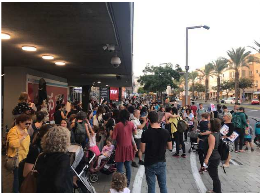
Eltern demonstrieren vor dem Tel Aviver Rathaus gegen die Verwendung von Plastikgeschirr im Hort.

IKEA folgt damit dem Vorbild anderer Unternehmen in Israel: So hat die Café-Kette Landwer schon vor einigen Wochen angekündigt, Plastik künftig aus seinen Filialen zu verbannen. Und das Unternehmen für Trinkwassersprudler, SodaStream, will seine Geschmackssirups künftig in Metallflaschen und nicht mehr in Plastikflaschen verpacken. Schon 2018 hatte SodaStream, mit dessen Produkt sowieso schon eine ganze Menge an Plastikflaschen eingespart werden kann, sämtliche Plastikhalter aus seinen Verpackungen entfernt: Eine Massnahme, die mindestens 5 Tonnen Plastik pro Jahr einspart.