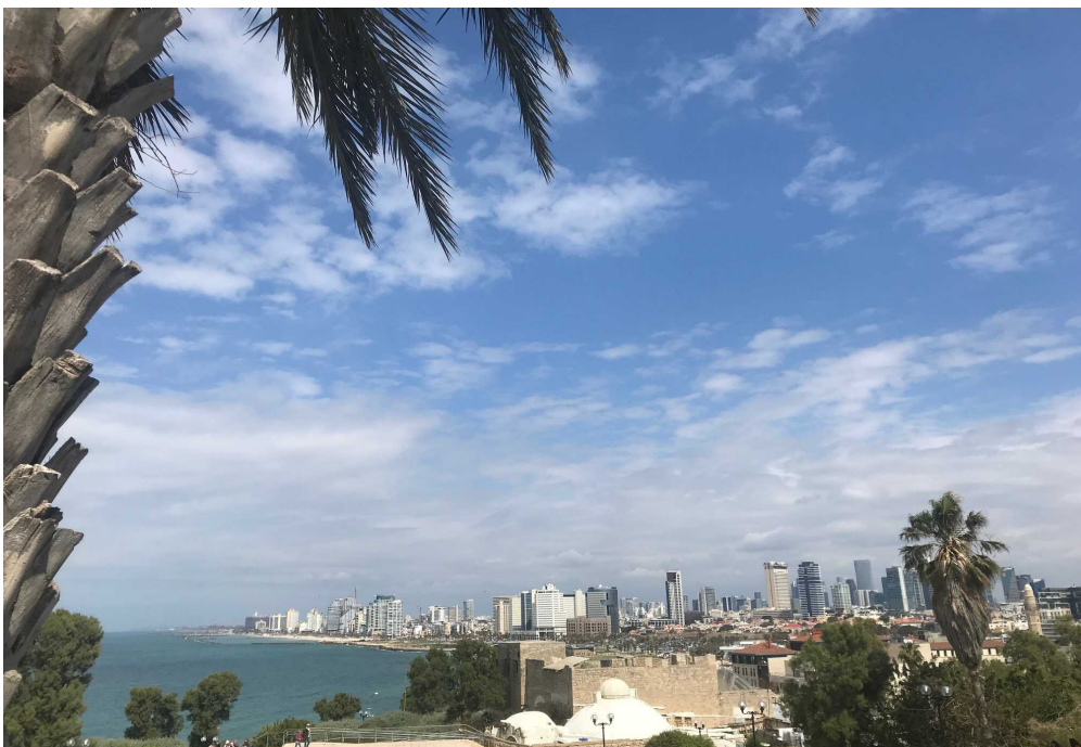
Blick über Tel Aviv: Eines der Wirtschaftszentren in Israel.

Die Liste der 20 stärksten Ökonomien wird übrigens von Luxemburg, der Schweiz und Irland angeführt.